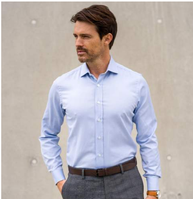
Chemise écologique twill bleu UB53