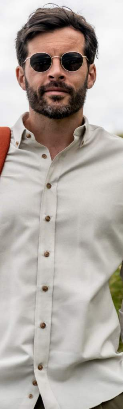
Chemise recyclée beige UM50