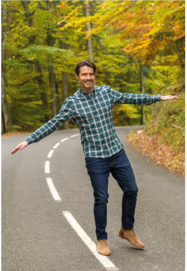
Chemise flanelle carreaux verts CG24