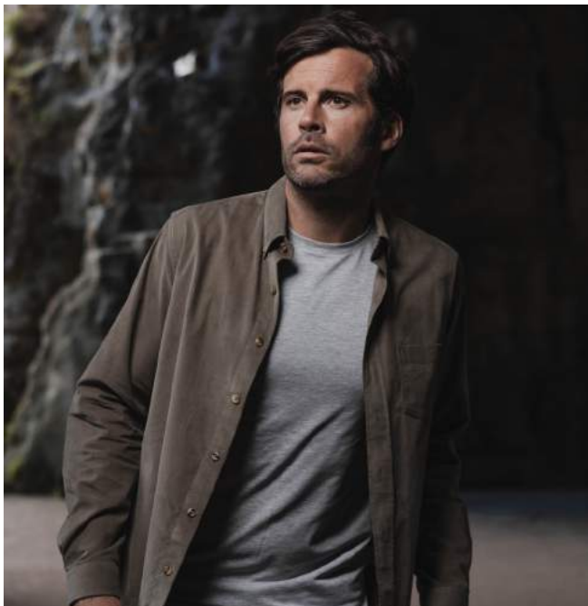
Chemise velours kaki UG24