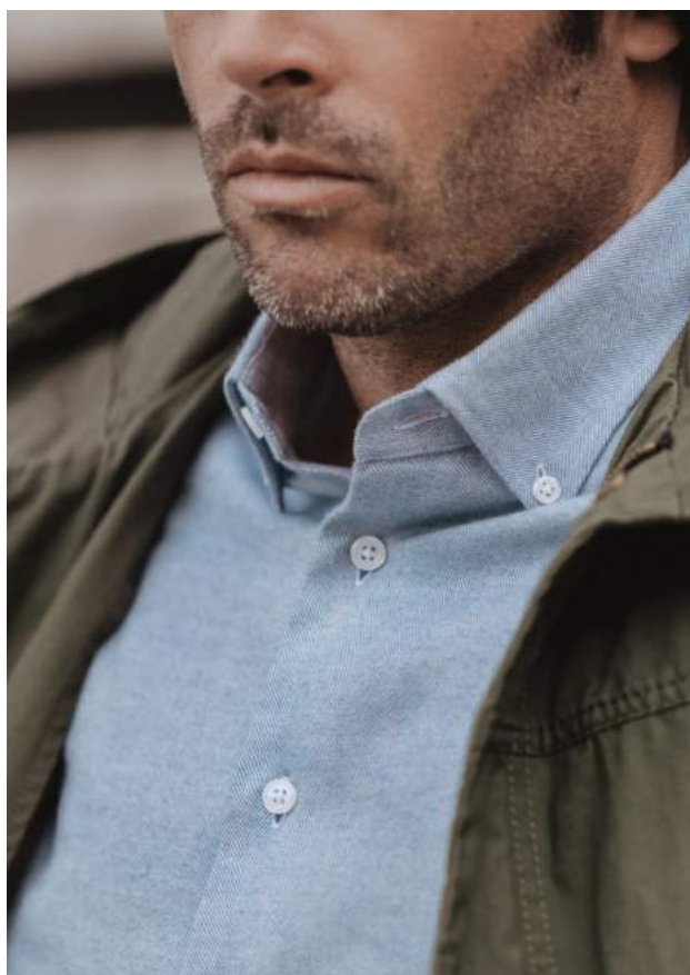
Chemise flanelle bleu clair UB52